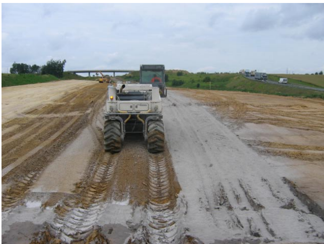
Stavba rychlostní silnice R6 s použitím VEP

Společnost ČEZ Energetické produkty s.r.o. vznikla jako moderní a zákaznicky orientovaná dceřiná společnost ČEZ, a.s. Jejím úkolem je zabezpečit spolehlivou a ekonomicky efektivní obsluhu zařízení předního a zadního palivového cyklu klasických elektráren a ekonomicky výhodný odsun a prodej vedlejších energetických produktů.